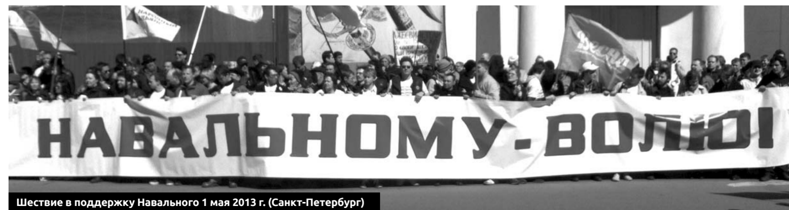
Шествие в поддержку Навального 1 мая 2013 г. (Санкт-Петербург)