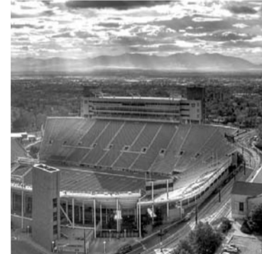
Rice Eccles Stadium, Солт-Лейк-Сити Вместимость: 45 017 зрителей Стоимость: 71 млн долларов