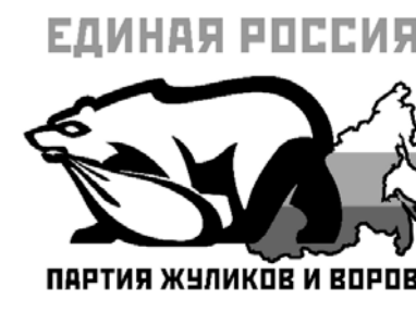
ПАРТИЯ ЖУЛИКОВ И ВОРОВ