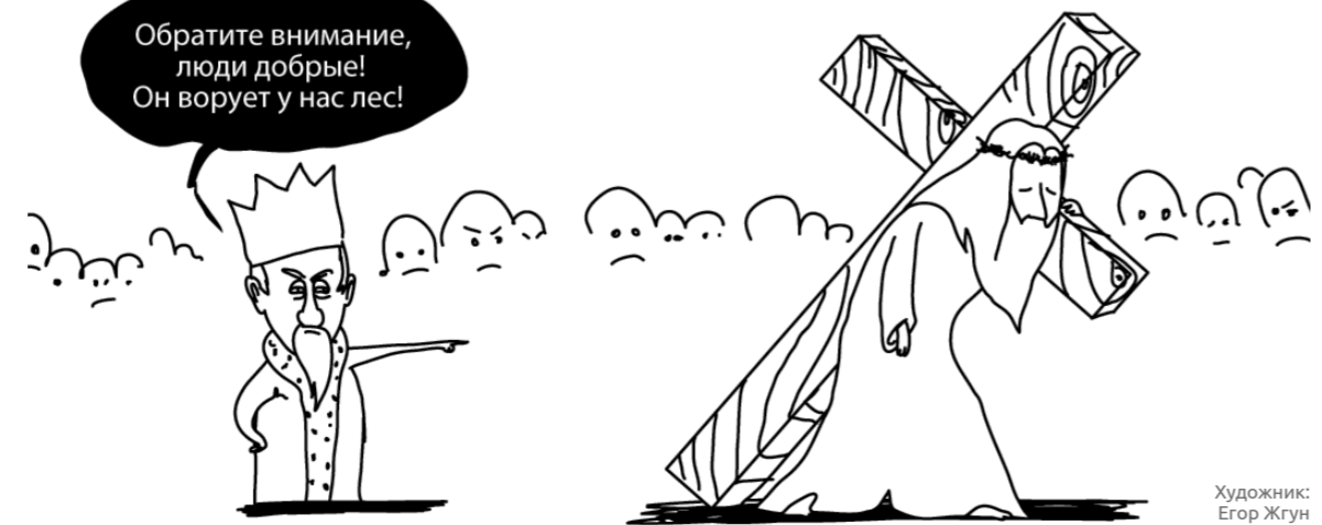
Художник: Егор Жгун

В зале суда велась видеосъемка. Поэтому каждый может проверить эти факты, посмотрев записи по адресу: www.navalny.ru/kirovles/video . Текст: Артем Вознесенский. При подготовке статьи использованы материалы трансляции Евгения Фельдмана