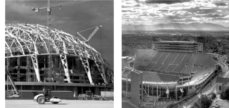
Центральный стадион «Фишт», Сочи Вместимость: 45 000 зрителей Стоимость: 780 млн долларов

51 миллиард долларов на Олимпиаду — в стране, где прожиточный минимум составляет 6913 рубля, а 17 миллионов россиян живут за чертой бедности (Росстат).