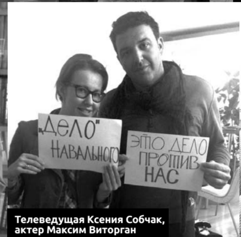
Телеведущая Ксения Собчак, актер Максим Виторган