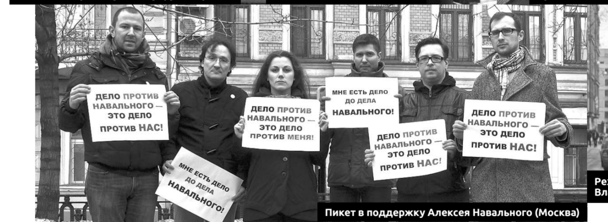
Пикет в поддержку Алексея Навального (Москва)