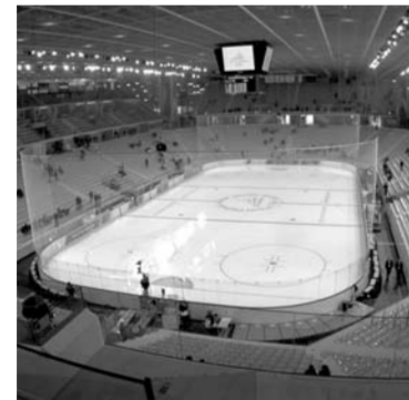
Torino Palasport Olimpico, Турин Вместимость: 12 500 зрителей Стоимость: 135 млн долларов