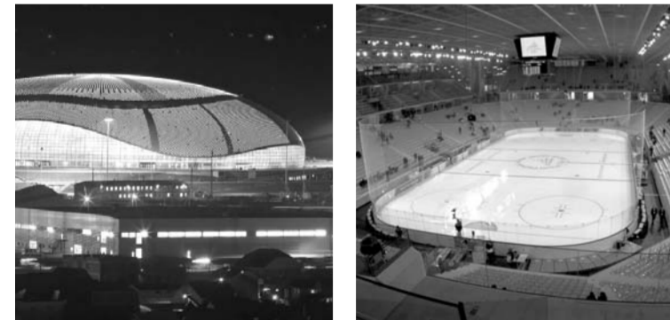
Большая ледовая арена, Сочи Вместимость: 12 000 зрителей Стоимость: 303 млн долларов