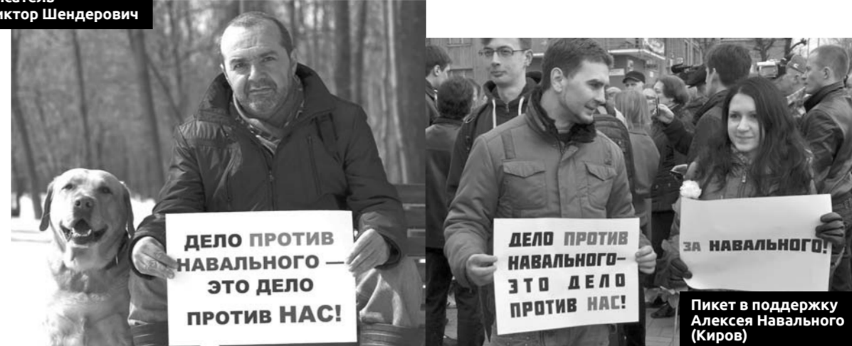
Пикет в поддержку Алексея Навального (Киров)