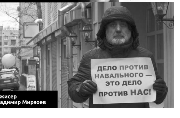
Режисер Владимир Мирзоев